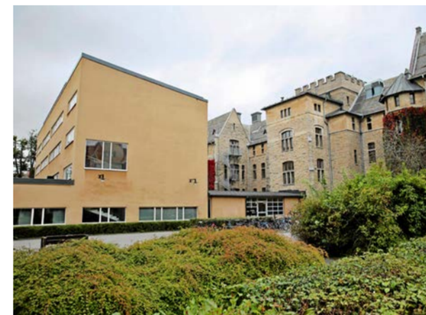
Skolans huvudbyggnad reser sig bakom skollokalerna som kom till på 60-talet.