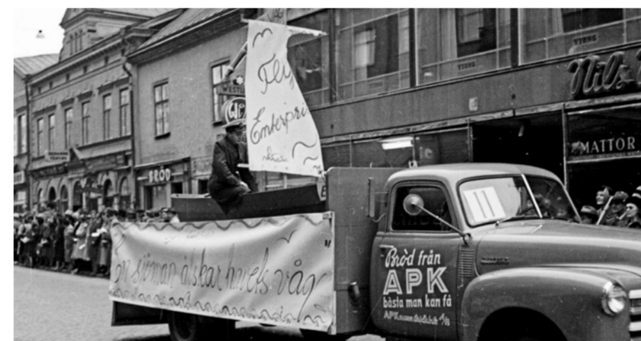
Varje år på första maj ordnade föreningen In Statu Nascendi på skolan med In Statutaget genom Örebro. Bilden är från 1952.