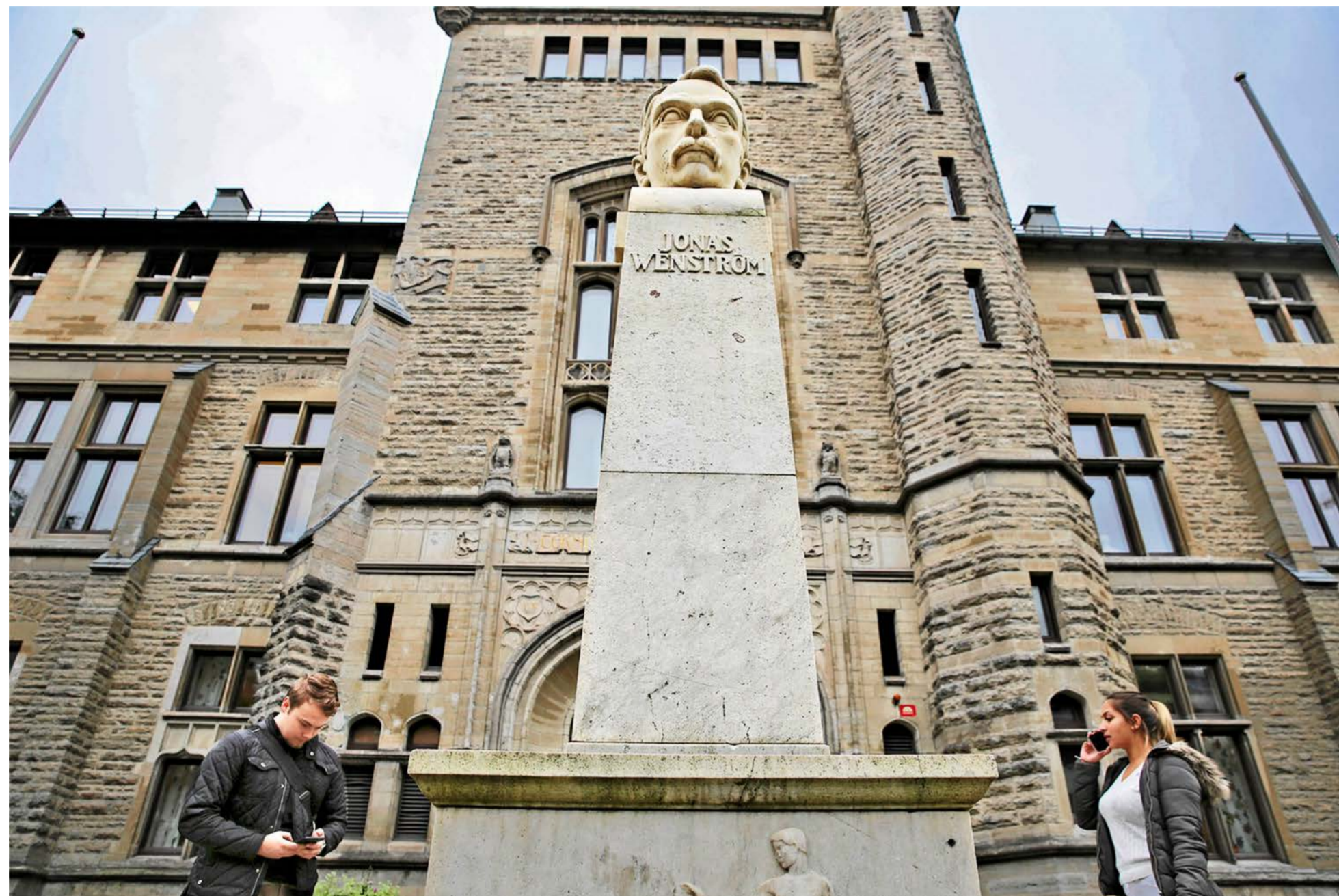
En byst av uppfinnaren Jonas Wenström, som lade grunden till Asea, möter besökarna till skolan. Men Wenström själv studerade aldrig på "Teknis". Trots detta ville ingenjörsgöreningen på skolan hedra uppfinnaren med en byst utanför entrén. Jonas Wenström tog studenten på Karolinska läroverket, kan tilläggas.

– Då skulle alla bli ingenjörer. Så är det inte längre. De sista teknisterna